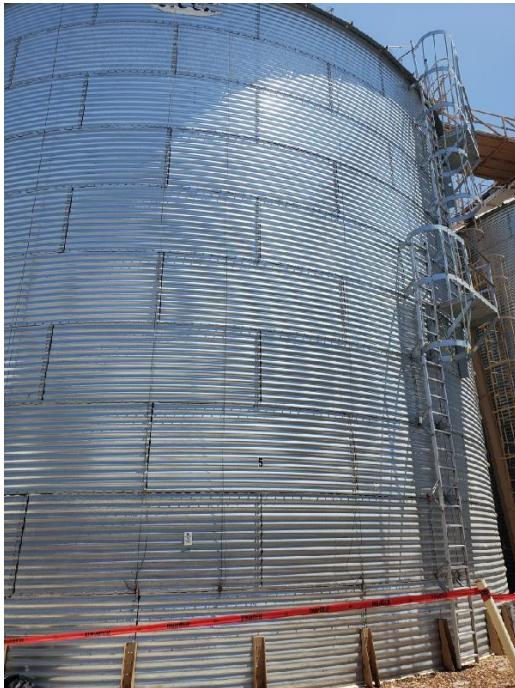
Imagem 1. Silo N° 10, Caso 1.

O tratamento de expurgo foi realizado em um silo em uma planta em Tulare – CA, no mês de julho, com 2.350 m 3 de volume. O silo apresentava problemas de hermeticidade em sua estrutura, entre as chapas e no aerador, sendo necessária uma preparação prévia antes de iniciar o expurgo.