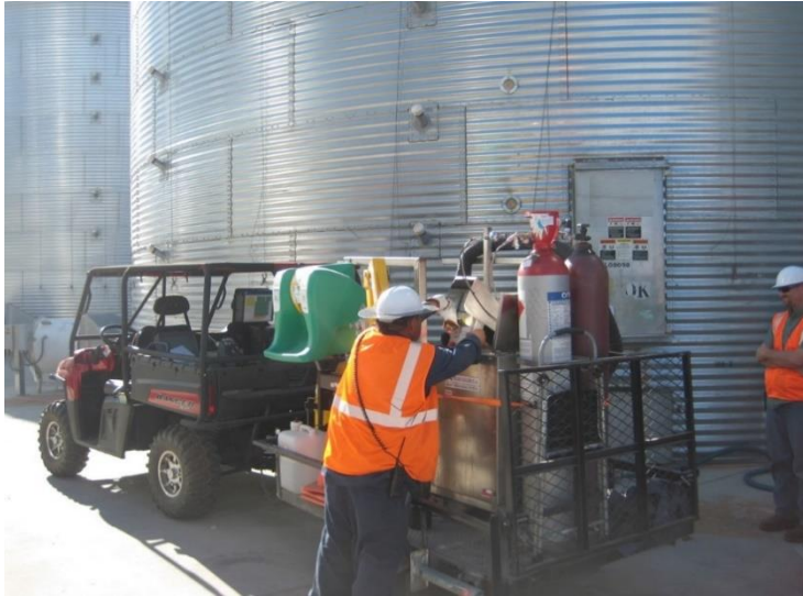
Figura 1. Silo N°129. Caso 2.

O tratamento de expurgo será realizado em um silo em uma planta em Kern – CA, no mês de maio, com 2.200m 3 . O silo apresentava alguns problemas de hermeticidade na base da sua estrutura e nos aeradores, sendo necessária uma preparação prévia antes de iniciar o expurgo, com pintura asfáltica, fita adesiva e silicone, conforme também ocorreu no caso anterior.